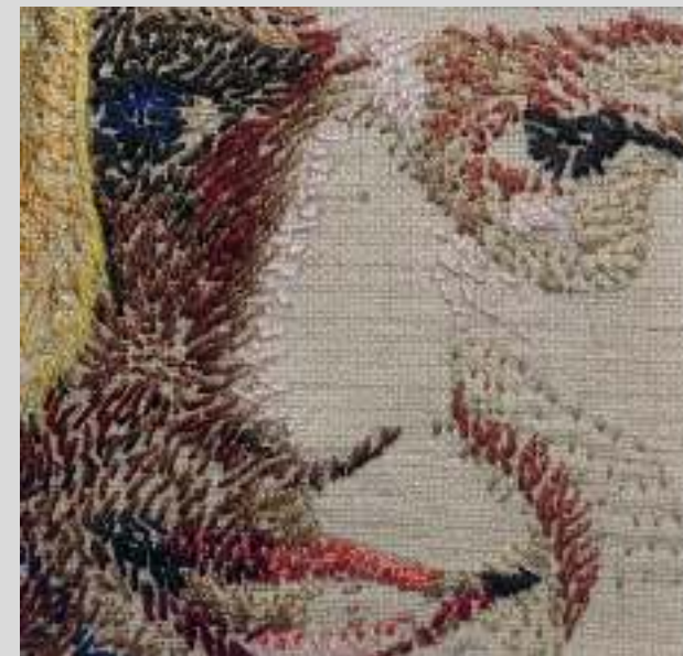
Kárpit, hímzés különdíj 22. Nemzetközi Miniatur kiállítás Kaposvár