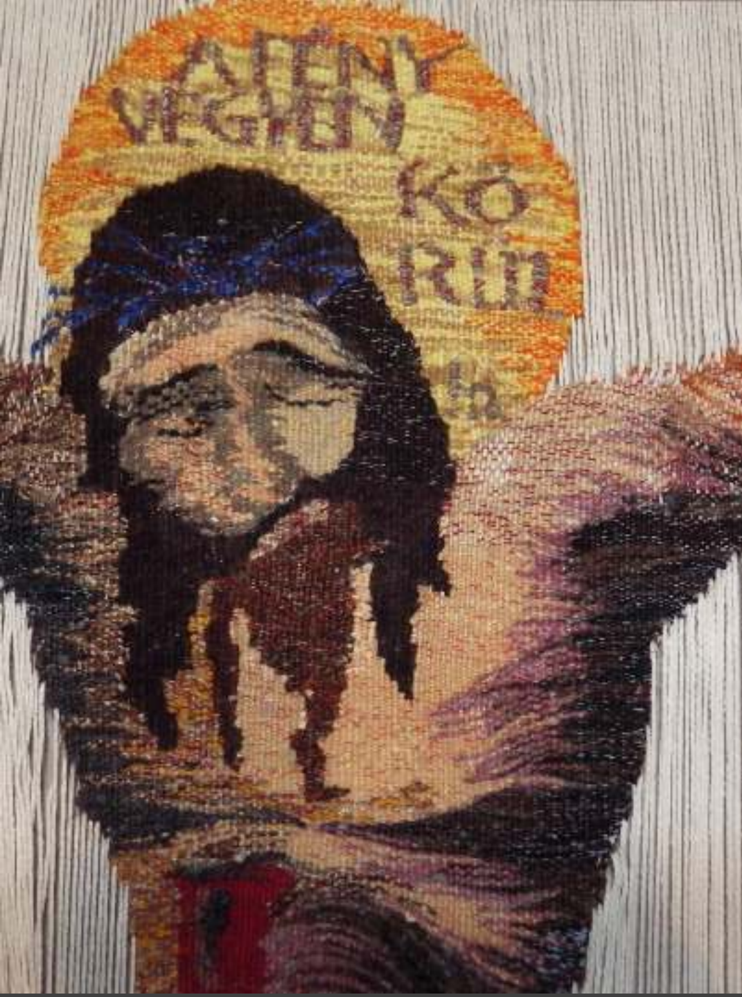
Krisztus ( részlet) 2014