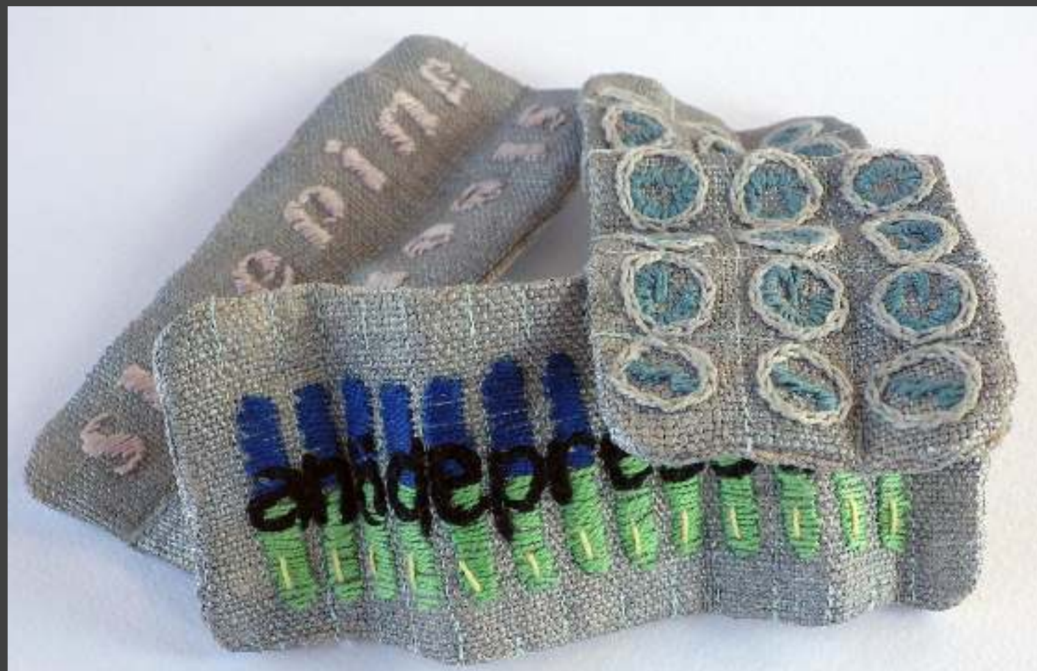
Kárpit, 20 X 20 cm