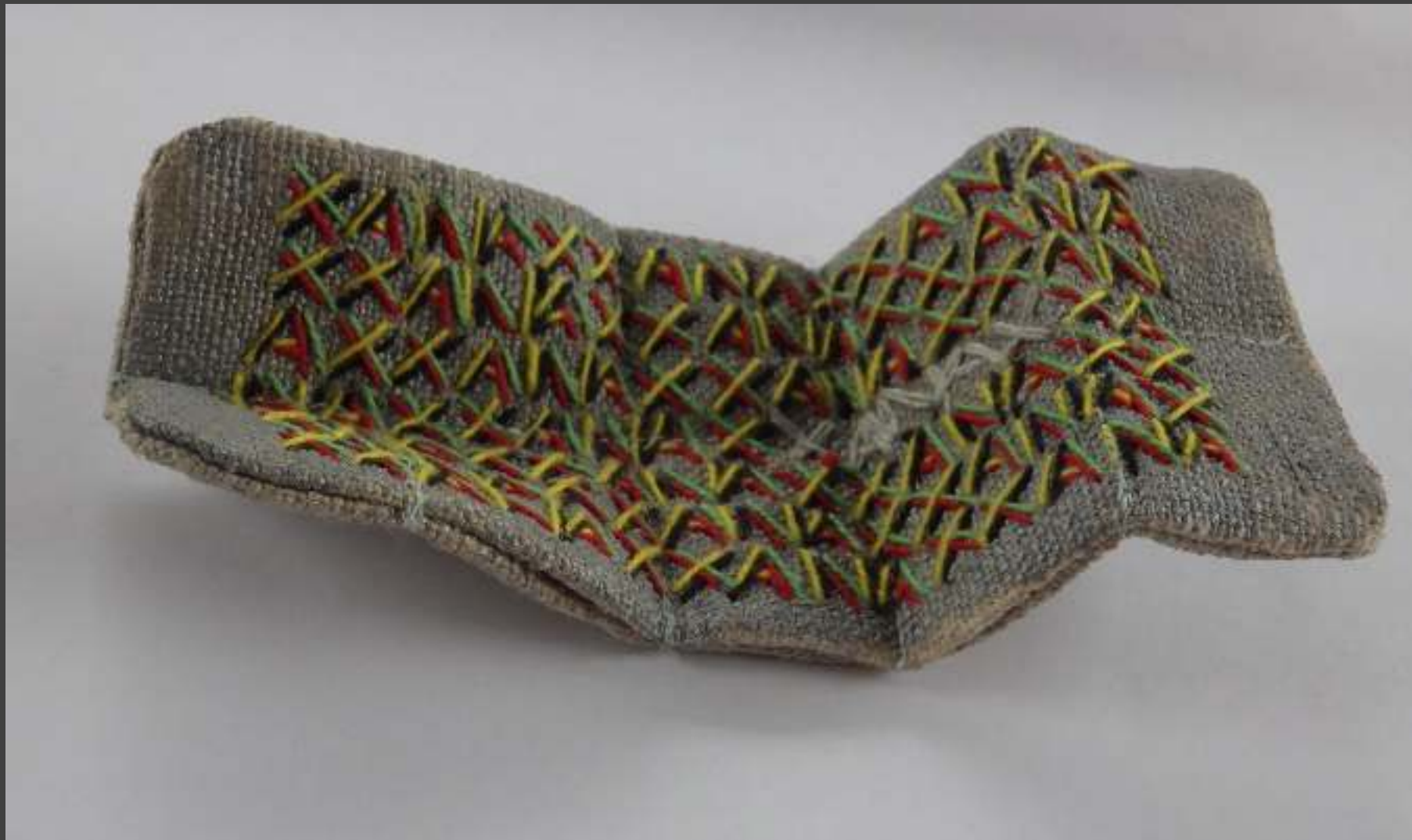
Kárpit, 13,5 cm x 6 cm x 3 cm