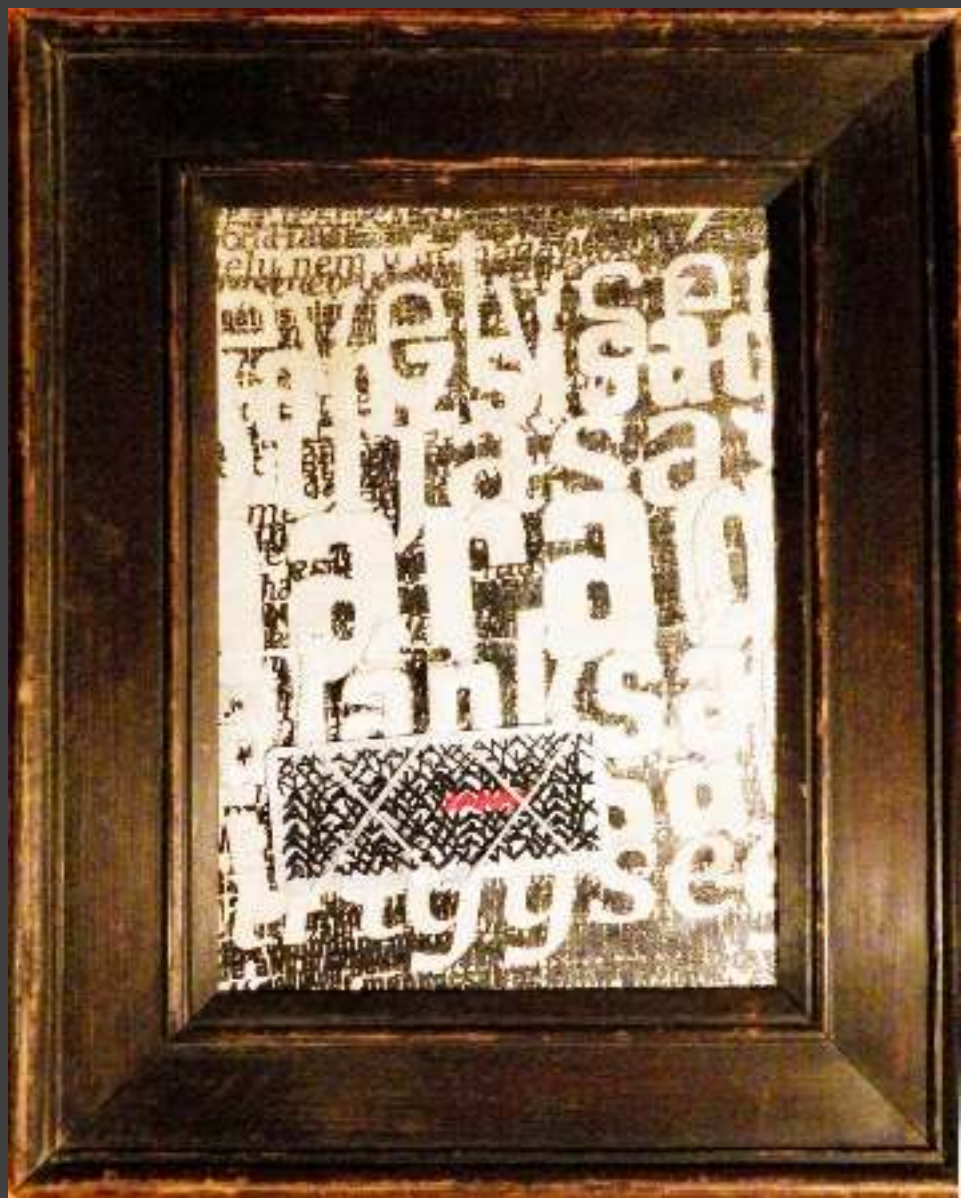
115 X 80 cm IX: Kortárs Keresztény Ikonográfia Biennálé „A hét főbűn”