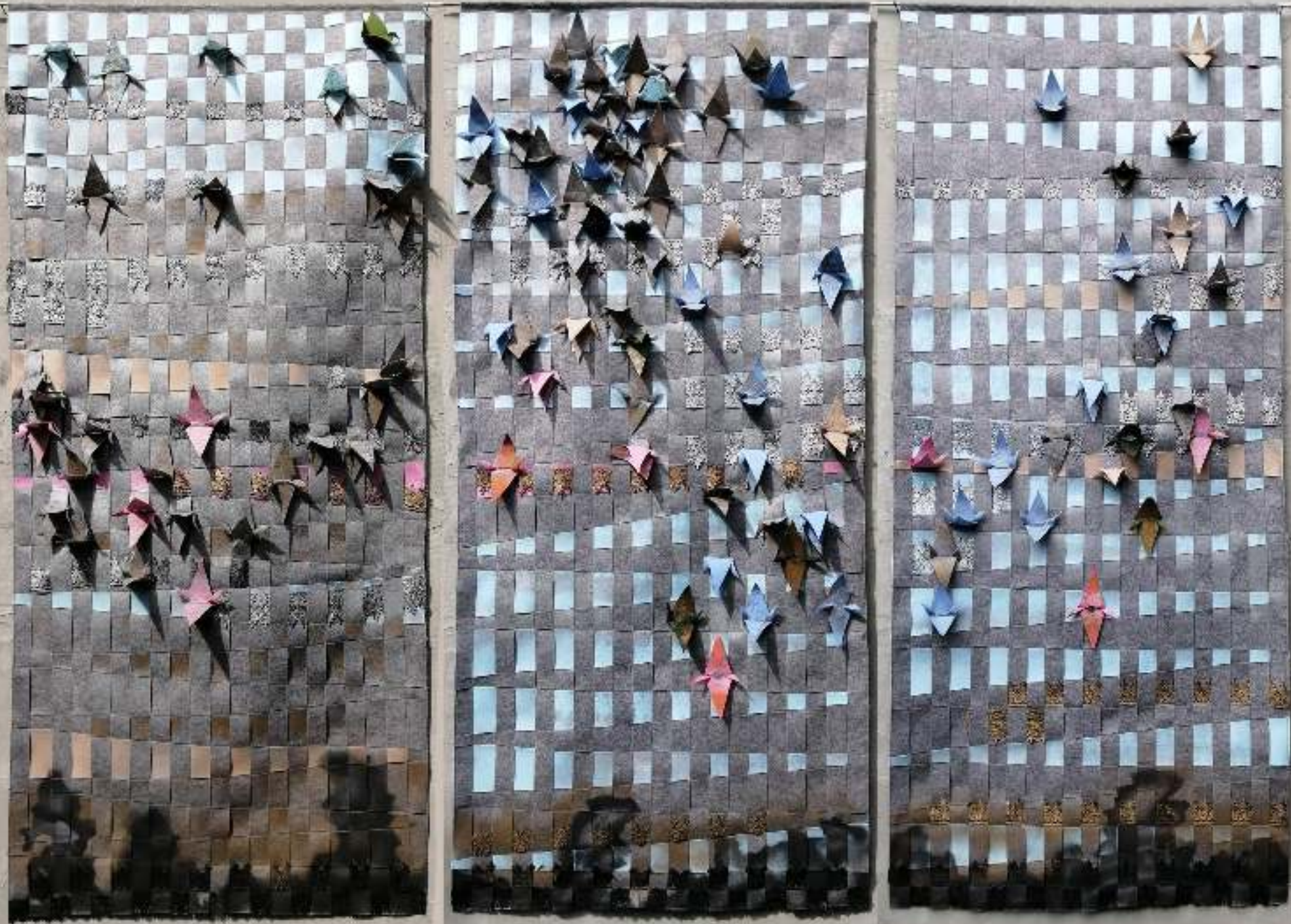
Starling shape I-II-III. 2019